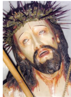
Imagen de medio cuerpo. Es un Ecce Homo, venerado como Justo Juez. Tiene las manos atadas, cruzadas por delante de su cuerpo. Eleva su mirada al cielo y tiene la boca entreabierta, gesto que acentúa la expresión doliente. El paño rojo que cubre su cuerpo, es de tela encolada, y deja libre la espalda, sobre la que se han esquematizado los nudos de la columna vertebral. Los toscos repintes modernos empobrecen la pieza. Apoya sobre una base polígona irregular.

Madera tallada, tela encolada; pasta, policromía moderna; ojos de cascarón. Altura máxima: 106,5 cm. ¿Salta? Fines siglo XVIII