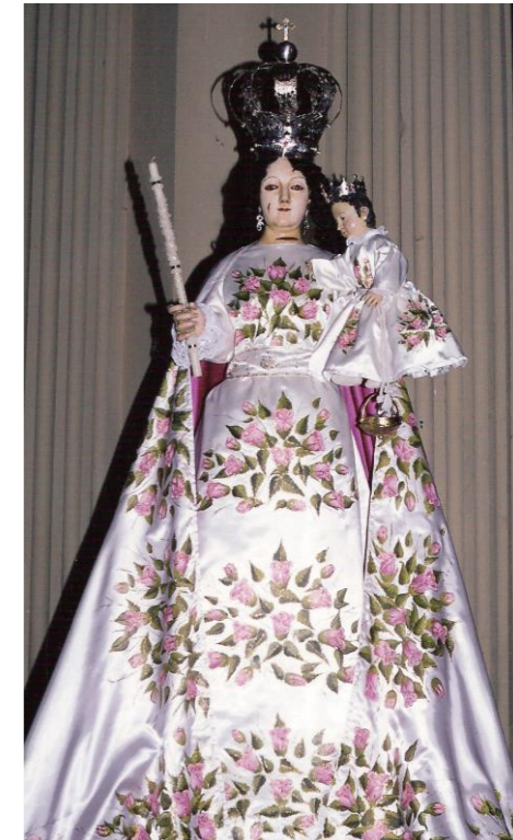
Imagen de la VIRGEN de la CANDELARIA de la VIÑA

El tipo de pliegues al apoyar la túnica sobre la peana nos permite afirmar que se trata de una imagen probablemente española del siglo XVII.