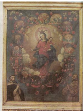
Imagen de la VIRGEN DEL ROSARIO

Año: fines S. XVII o principios del XVIII Técnica: óleo sobre tela Medidas: 160 x 120 cm (por Roberto González Bosch)