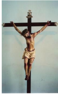
Imagen de tres clavos. Figura de Cristo muerto con la cabeza caída sobre el hombro derecho. De tratamiento anatómico convencional, lo desmerecen repintes y barnices.

En el Nicho superior se ubica: CRUCIFIJO