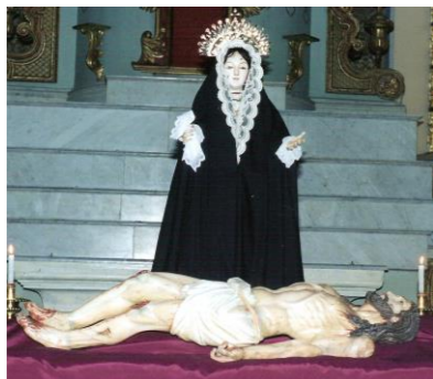
Imagen de la Virgen DOLOROSA y CRISTO YACENTE

De vestir. Un tronco apenas esbozado, apoya en listones de madera. La cabeza está preparada para recibir peluca, teniendo una indicación elemental de cabello corto que cae sobre la nuca. Los repintes modernos empobrecen la pieza. Está revestida con túnica y manto de paño negro. Corona su cabeza una aureola de plata repujada y cincelada en forma de arco circular con doce estrellas. Se encuentra en la Sacristía de la Iglesia.