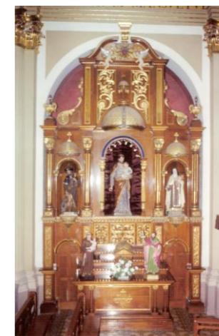
Imagen del CRISTO DE LA VIÑA

En este caso por debajo de las calles laterales del primer cuerpo se abren dos puertas que comunican entre sí por detrás del sotabanco. El ático, que supera la altura del vano, remata en frontón curvo por delante del que se ubican dos ángeles que sujetan el Sagrado Corazón de Jesús. Madera tallada y dorada.